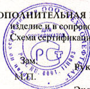
Схема сертификации – За

ДОПОЛНИТЕЛЬНАЯ ИНФОРМАЦИЯ Знак соответствия по ГОСТ Р 50460 наносится на изделие и в сопроводительных технических документах.